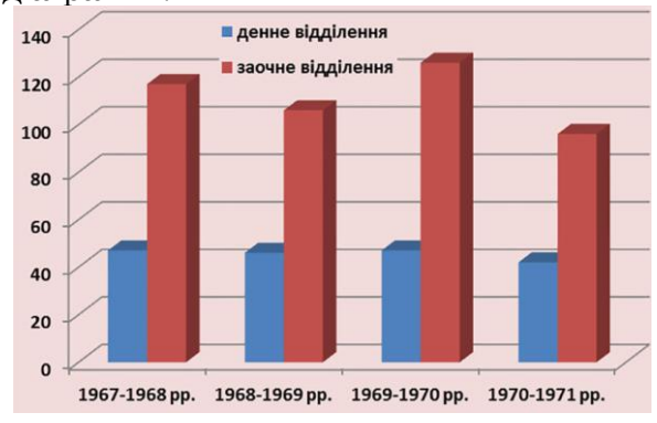
Діаграма 1. Кількісні показники контингенту випускників педагогічного факультету (денного та заочного відділень) Слов'янського педагогічного інституту

Згідно 3 Наказом N_{\Omega} 537 від 12.11.1968 р. дошкільний факультет було перейменовано у педагогічний зі спеціальностями: "педагогіка і психологія (дошкільна)" та "дефектологія". У 1967–1968 навчальному році педагогічний факультет закінчили 47 випускників денного відділення та 117 заочного; у 1968-1969 навчальному році - 46 випускників денного відділення та 106 заочного; 1969-1970 навчальному році - 47 випускників денного відділення та 126 заочного; 1970-1971 навчальному році - 42 випускники денного відділення та 96 заочного. Наведені факти безперечно свідчать про стабільну затребуваність і набуття поступової популярності дошкільного профілю навчання. Кількісні дані випускників педагогічного факультету (денного заочного відділень) представлено діаграмі 1.