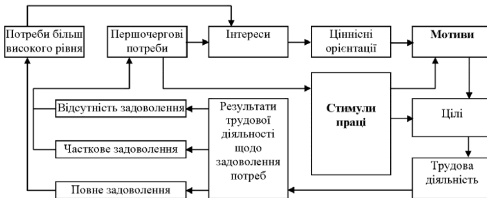
Рис. 3. Механізм мотивування трудової діяльності найманих працівників (схема розроблена Д. Т. Куліковим [10, с. 44]).

Формування готовності школярів, студентів до військової служби за контрактом чи у резерві, залежить від мотивації. Проаналізувавши наукові праці, присвячені мотивації і стимулюванню трудової діяльності найманих працівників, Д. Т. Куліков дійшов висновку, що мотивація праці являє собою безперервний і циклічний процес трудової діяльності [10, с. 43–44] (рис. 3). Крім того, Д. Т. Куліков звертає увагу на те, що у наукових працях часто ототожнюються поняття «мотив праці» і «стимул праці». В одному випадку йдеться про працівника, що прагне отримати благо внаслідок трудової діяльності (мотив), в іншому – про орган управління, який володіє переліком благ, необхідних працівнику, і надає їх йому за умови ефективної трудової діяльності (стимул) [10, с. 50].