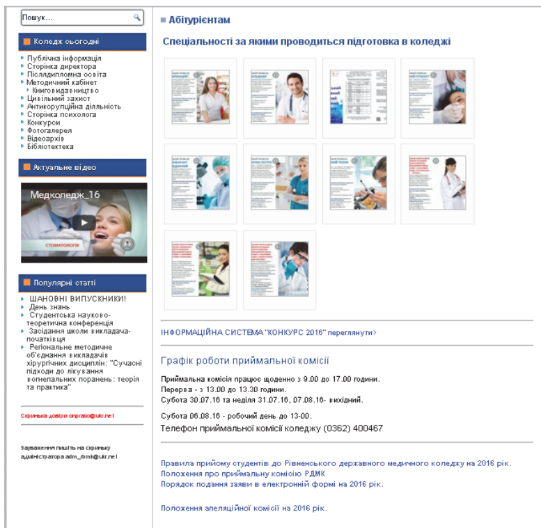
Рис. 1. Скриншот сторінки «Абітуріентам».

Підтвердження важливості сторінки «Абітуріентам» знаходимо у статистиці відвідування сайту та його окремих підрозділів, що знаходиться на адмінпанелі. Як показують результати статистики за 2016 рік кількість відвідувачів Web-сайту коледжу склала 57654 із них 21052 (36,5%) це відвідування сторінки для абітурієнтів. Виходячи із результатів фактично третина відвідувачів сайту коледжу це потенційні абітурієнти, котрі згодом стали абітурієнтами нашого навчального закладу та прийняли участь у вступній кампанії або їх батьки.