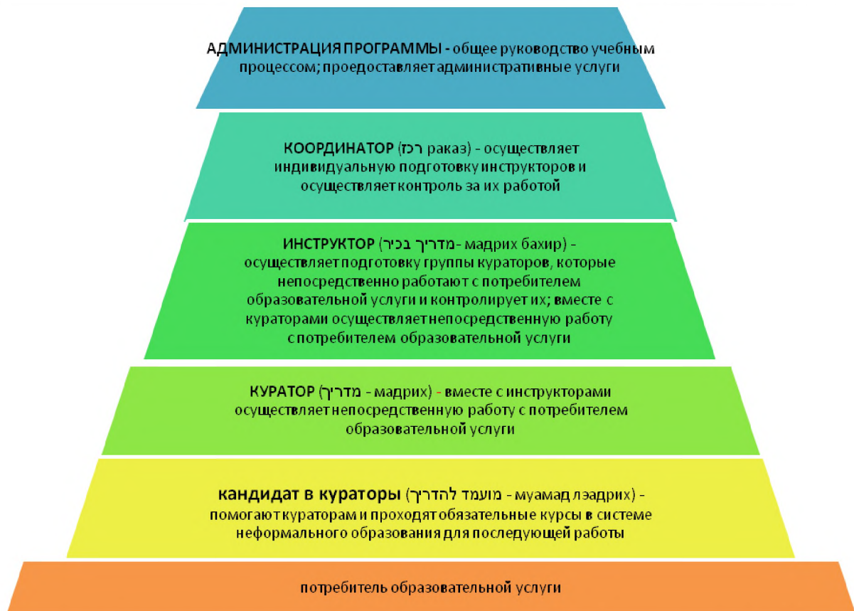
Рис. 2. Вертикаль педагогических работников для Программы НААЛЕ

Еще одним примером взаимодействия формального и неформального образования в современном Израиле можно считать сеть учебных заведений проекта Мофет. В 1992 году в Израиле педагогами-репатриантами физико-математических школ бывшего СССР совместно с учеными была создана всеизраильская сеть школ «Мофет». Главная задача этих школ – развитие у учащихся интереса к учебе, к углубленному изучению математики, физики, информатики, стремление в дальнейшем работать на производствах «хай-тек», заниматься наукой. Не менее важная задача системы «Мофет» – помочь детям репатриантов в полной мере реализовать свои возможности, лучше адаптироваться в новой стране.