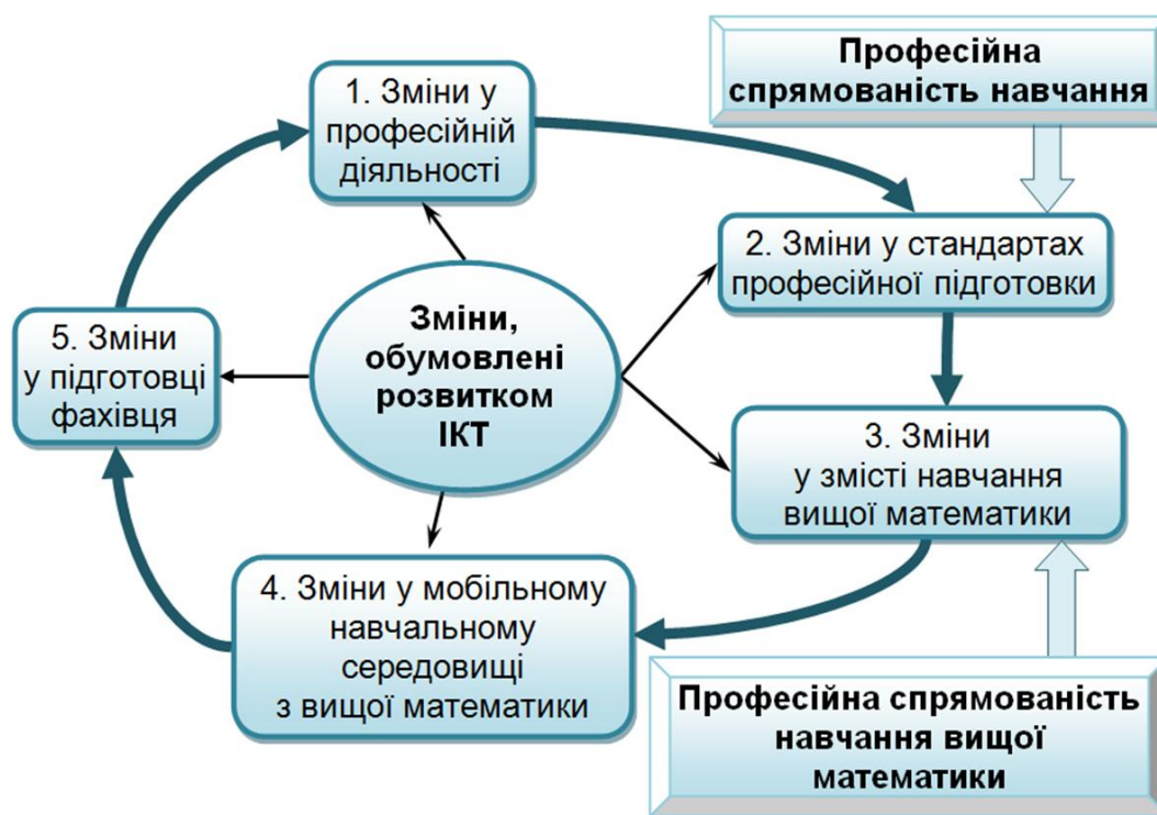
Рис. 4. Модель розвитку мобільного математичного середовища з вищої математики для майбутніх інженерів електромеханіків

Отже, розвиток мобільного навчального середовища з вищої математики ґрунтується на змінах, зумовлених насамперед розвитком ІКТ (рис. 4), що в свою чергу породжує зміни у: професійній діяльності (виникають нові ІКТ у професійній діяльності); стандартах професійної підготовки (відбувається оновлення засобів навчання); змісті навчання вищої математики (відбувається оновлення змісту та засобів навчання вищої математики); мобільному навчальному середовищі з вищої математики (відбувається зміна мобільних засобів навчання вищої математики); підготовці фахівця (відбувається розвиток професійних ІКТ-компетентностей).