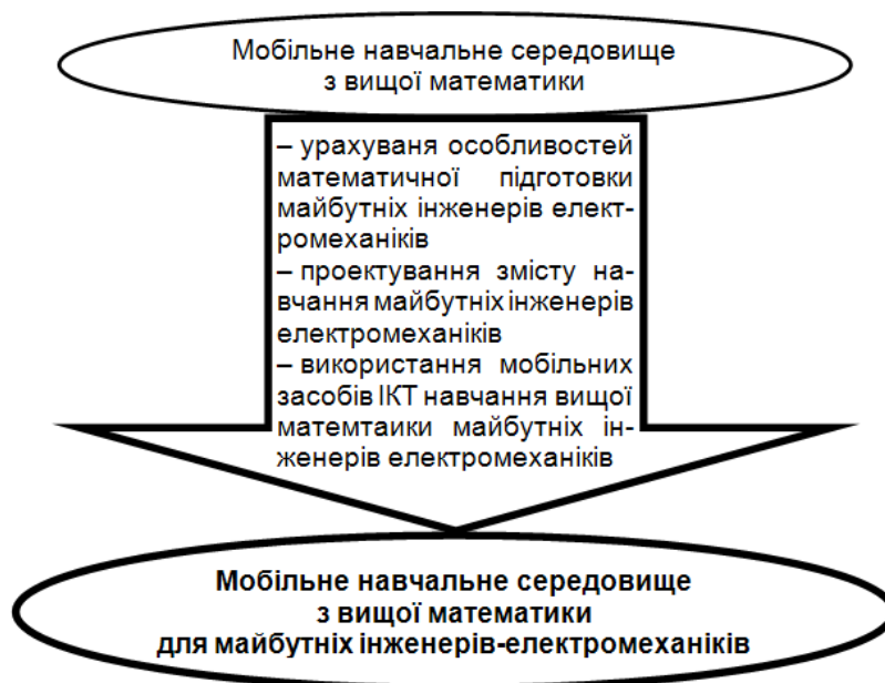
Рис. 2. Схема формування мобільного математичного середовища з вищої математики для майбутніх інженерів електромеханіків

Формування ж МНС з вищої математики для майбутніх інженерів електромеханіків необхідно здійснювати з дотриманням принципу професійної спрямованості навчання. Адже, вища математика є основою професійної підготовки майбутніх інженерів-електромеханіків, оскільки володіння математичним апаратом на належному рівні надає можливість ефективно застосовувати набуті знання на практиці, чітко розуміти способи застосування того чи іншого математичного методу при розв'язанні задач професійного спрямування (рис. 2).