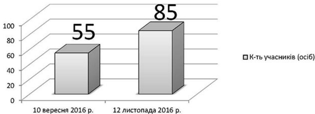
Рис. 3. Динаміка кількості учасників підліткового клубу.

Для підтвердження дієвості організації дозвілля в клубі окреслимо одержані результати впливу засобів і способів соціально-педагогічної роботи на вияв підлітків брати участь у роботі клубу. З метою залучення нових учасників підліткового клубу в кінці серпня 2016 року організовано проведення дитячого майданчику, квесту та заохочення засобом отримання нагороди «Приведи друга – отримай приз!». Зазначені засоби форми і форми роботи позитивно вплинули на новий набір учасників до клубу. Так, динаміка кількості учасників клубу зросла з 55 до 85 осіб (рис. 3).