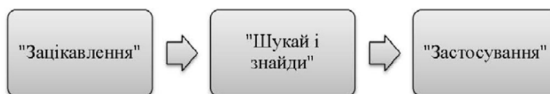
Рис. 2. Структура «Уроку мудрості»

лаконічним, змістовним, налаштовувати підлітків на тему.