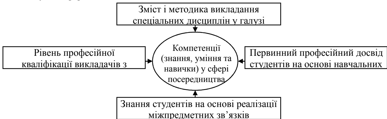
Рис. 1. Вплив педагогічних чинників на формування професійної компетентності соціальних працівників у сфері посередництва

створюють передумови для інтеграції теорії і практики та здійснення професійного втручання в посередництві. Представлена модель дозволяє проаналізувати та зіставити новостворені освітні програми у сфері підготовки соціальних працівників із накопиченим досвідом, а також започаткувати формування нових програм професійної освіти у цій сфері.