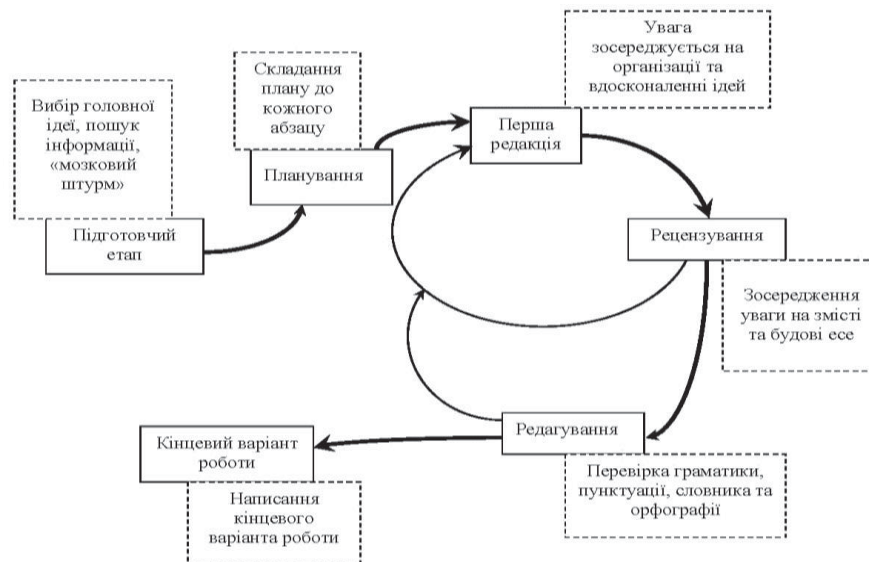
Рис. 1. Когнітивна мапа процесу написання есе

Ще одним типом когнітивної мапи можна вважати циклічну модель . Наведемо відповідний приклад мапи, в якій позначені стадії створення есе [7] та його структуру (рис. 2):