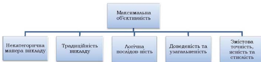
Рис. 3. Мапа-діаграма, яка ілюструє вимоги до академічного есе

Інший тип мапи – мапа-«павук» – представляє жанрове розмаїття есе (рис. 4). Існують декілька методів написання есе, хоча більшість авторів, як правило, користуються одним незмінним. Оскільки автори використовують письмо як засіб дослідження, вони починають писати, ще не будучи готовими до цього. Зазвичай есе починають писати не з початку до кінця, а з тієї частини, яка вже готова. Перед початком написання дослідник обирає тему та занотує ключові слова до неї. Дослідження розбіжностей також