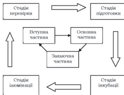
Рис. 2. Циклічна мапа-модель структури та стадій створення есе

Іншим типом когнітивної мапи може бути діаграма . Наведемо приклад діаграмного мапування, яке ілюструє вимоги до есе як академічного письма (рис. 3):