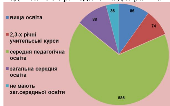
Діаграма 2. Освітній рівень завідувачів дошкільних установ Донецької області за 1962 р.

Як свідчать статистичні звіти за 1961 та 1962 роки, ситуація з професійним рівнем працівників дошкільних закладів набувала поступових змін. Так, у 1961 році кількість завідувачів дошкільних закладів із вищою освітою вже складала 10,2 % від загального числа, а тих, які закінчили 2-х, 3-х-річні учительські інститути – 8,8 % [3, с. 131]. Дані з освітнього рівня завідувачів дошкільних закладів за 1962 р. подано на діаграмі 2.