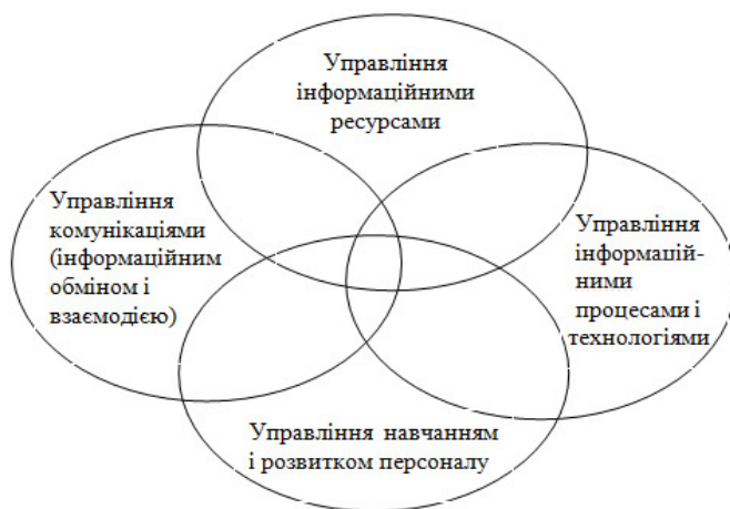
Рис. 2. Комплекс базових функцій інформаційного менеджменту

Оскільки жодна з означених функцій не реалізується окремо одна від одної, а здійснювані для цього процедури планування, організації і контролю нерозривно пов'язані в цілісній структурі управління інформацією, то схематично зобразимо їх як єдиний комплекс базових функцій інформаційного менеджменту (рис. 2).