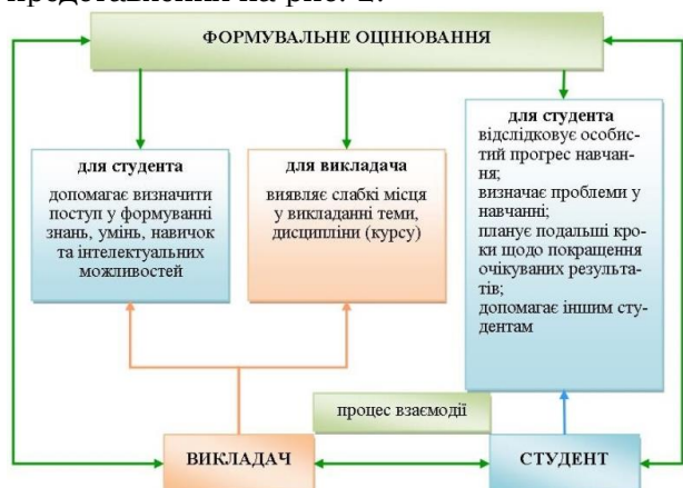
Рис. 2. Взаємодія учасників освітнього процесу при формувальному оцінюванні

Формувальне оцінювання являє собою процес постійної взаємодії педагога та здобувача освіти, де кожен з учасників освітнього процесу дотримується принципів, представлених на рис. 2.