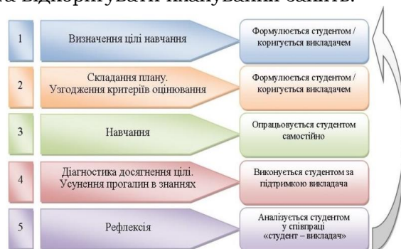
Рис. 3. Структура процесу формувального оцінювання

– як оптимізувати методику викладання та відкоригувати планування занять.