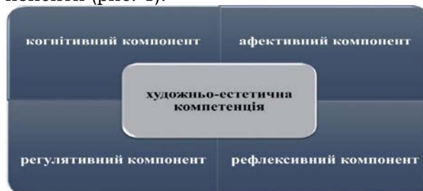
Рис. 1. Структура художньо-естетичної компетентності

Результати попередніх досліджень дозволяють зробити висновок, що ХЕК — складний конструкт, в структурі якого можна умовно виділити когнітивний, афективний, регулятивний, рефлексивний компоненти (рис. 1).