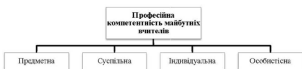
Рис. 1. Основні види професійної компетентності майбутніх вчителів, що формуються на етапі їх підготовки в педагогічному закладі освіти

На рисунку 1 представлені основні види професійної компетентності майбутніх вчителів, що формуються на етапі їх підготовки в педагогічному закладі освіти.