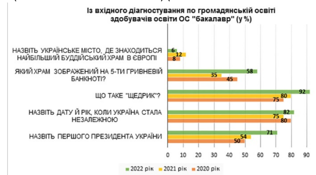
Рис. 1. Порівняльна таблиця вхідного діагностування по громадянській освіті здобувачів освіти ОС «бакалавр» за 2020–2022 роки

1. Нашим здобувачам освіти не вистачає знань про рідний край, державу України, українські звичаї та традиції. Такий висновок ми зробили із кілька річного викладання вказаних дисциплін, яке починається вхідним діагностуванням. Серед кількох блоків запитань традиційно ми запитуємо й про важливі історичні, культурні події із життя України. Із результатами (подані в відсотках) можна ознайомитися на діаграмі (рис. 1). На що ми звертаємо увагу: є питання, які має знати кожний українець / українка, незалежно від рівня освіти, гендерних, релігійних чи інших вподобань. Наприклад, першим Президентом України багато хто називає Михайла Грушевського, замість Леоніда Кравчука. І навіть на таке просте, на наш погляд, питання про «Щедрик», дехто відповідає, що це колискова або колядка?