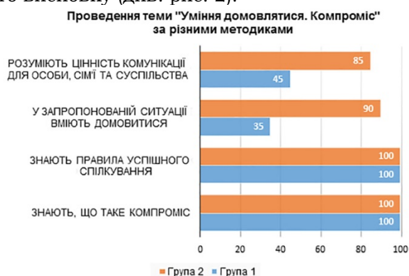
Рис. 2. Порівняльна таблиця результатів проведення теми «Уміння домовлятися. Компроміс» за різними методиками

3. Надзвичайно важливим завданням, яке сьогодні стоїть перед викладачем із педагогічних спеціальностей закладу вищої освіти, є не просто передача знань здобувачам освіти, а формування в них навичок та здатностей до активного, творчого впровадження отриманого досвіду. Практичні навички можна отримати тільки в процесі активного та інтерактивного навчання. Невеликий експеримент щодо вказаної позиції дає нам підстави до такого висновку (див. рис. 2).