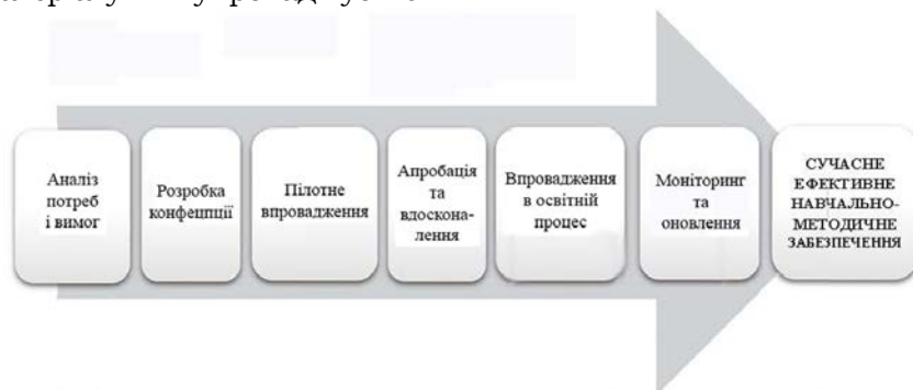
Рис. 2. Етапи розробки сучасного навчально-методичного забезпечення неперервної підготовки вчителя іноземної мови (Каніболоцька О. А.)

6. Моніторинг і оновлення. Технологія професійної підготовки вчителів іноземної мови повинна постійно моніторитись та оновлюватись із урахуванням нових тенденцій у сфері освіти й вимог ринку праці. Навчально-методичне забезпечення потребує періодичного оновлення, врахування інноваційних підходів і передового досвіду.