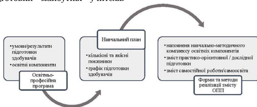
Рис. 3. Обов'язкові компоненти/ умови впровадження навчально-методичного забезпечення неперервної професійної підготовки майбутніх учителів іноземної мови

іноземної мови в університеті відіграє ключову роль у формуванні професійної іноземної компетентності. Воно сприяє активному, цікавому й ефективному навчанню, що допомагає випускникам стати професіоналами у сфері навчання іноземних мов. Зміст навчально-методичного забезпечення залежить від вимог освітньо-професійної програми (далі ОПП) підготовки здобувачів освітнього ступеня бакалавра / магістра та змісту навчального плану (рис. 3).