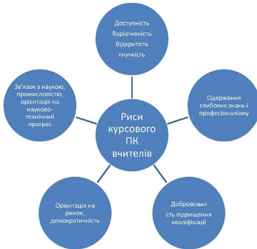
Рис.1. Характерні риси системи курсового підвищення кваліфікації вчителів у Великій Британії

(розроблено автором на основі опрацювання джерел [2; 4; 5]).