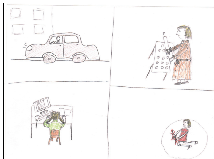
Рис. 2. «Кінетичний малюнок сім'ї»